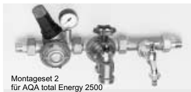
Montageset 2 für AQA total Energy 2500