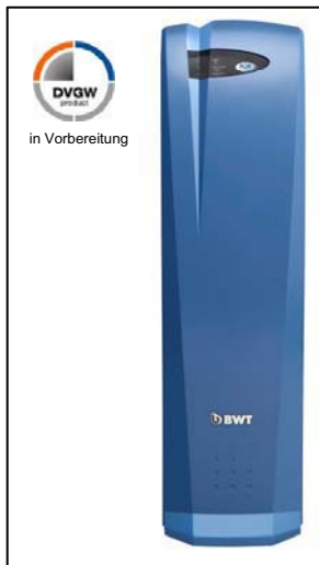
AQA total Energy 2500