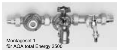
Montageset 1 für AQA total Energy 2500

Montageset 1, für den Einsatz bis max. 6 bar Vordruck und Montageset 2 mit Druckminderer ab 6 bar Vordruck. Die Sets sind aus Bestandteilen unseres Hauswasserverteilsystems HydroMODUL zusammengesetzt und können daher problemlos entsprechend erweitert werden.