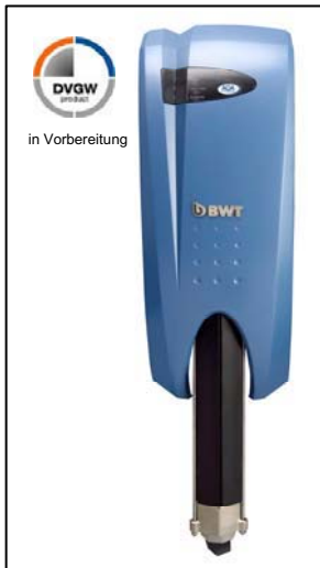
AQA total Energy 1500