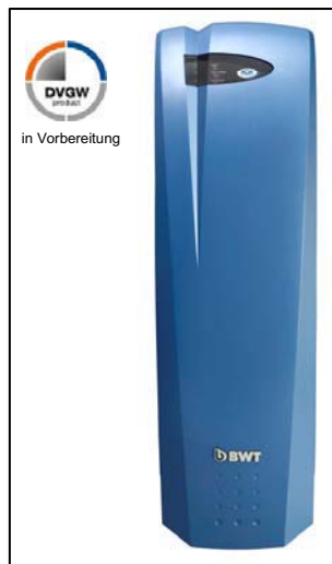
AQA total Energy 4500

AQA total Energy mit der international geprüften Bipolartechnik für garantierten Kalkschutz ohne Salz: