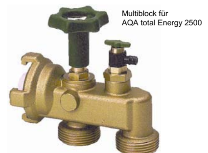
Multiblock für AQA total Energy 2500

Dadurch wird auch die Bedienung bzw. Wartung des AQA total Energy Gerätes wesentlich erleichtert.